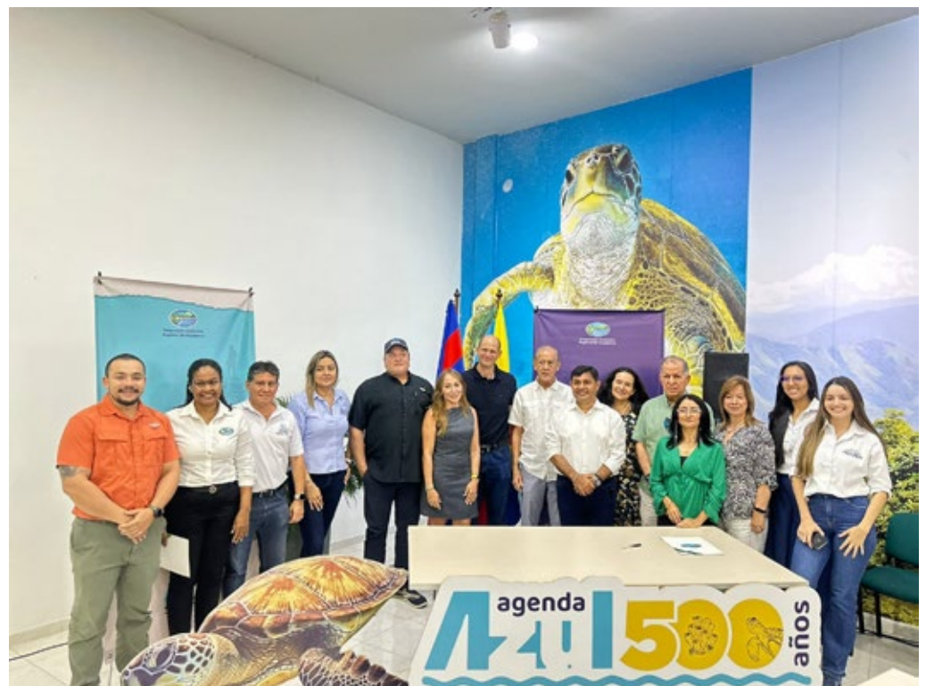
Formalización de Acciones Marino-Costeras Agenda Azul Santa Marta 500 años

Firma de contrato para la prevención y manejo de incendios forestales, especialmente en zonas de manglar y ecosistemas vulnerables.