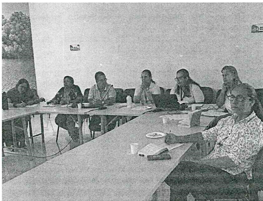
CIDEA DEPARTAMENTAL COMITÉ TECNICO CONSTRUCCIÓN DE LA PEAD 27 septiembre de 2024

Nacionales Naturales de Colombia, territorial Caribe, Secretaria de Educación del Municipio de Ciénaga.