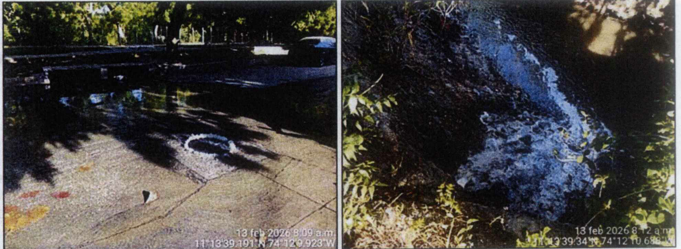
Imagen 5. Rebosamiento de agua residual en pozo de inspección y vertimiento en el río Manzanares.

“POR MEDIO DE LA CUAL SE IMPONE A LA EMPRESA DE SERVICIOS PÚBLICOS DEL DISTRITO DE SANTA MARTA ESSMAR E.S.P. UNA MEDIDA PREVENTIVA POR VERTIMIENTOS NO AUTORIZADOS AL RÍO MANZANARES – SECTOR BARRIO VILLA ALEJANDRÍA EN EL DISTRITO TURÍSTICO CULTURAL E HISTÓRICO DE SANTA MARTA.