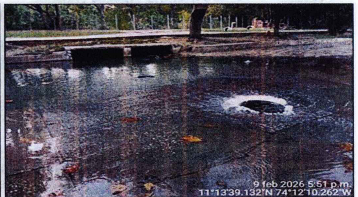
Imagen 1. Rebosamiento de agua residual en pozo de inspección de la red de alcantarillado sanitario.