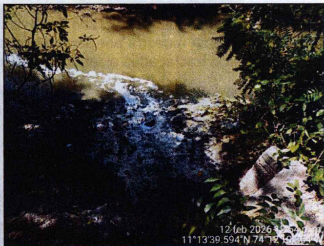
Imagen 4. Rebosamiento de agua residual en pozo de inspección y vertimiento en el río Manzanares.