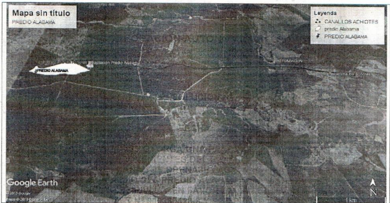
Cuadro 2. Área total del predio en beneficio de la concesión de aguas:

“POR MEDIO DE LA CUAL SE OTORGA UNA RENOVACIÓN DE UNA CONCESIÓN DE AGUAS SUPERFICIALES PROVENIENTES DEL RÍO FUNDACIÓN A TRAVÉS DEL CANAL LOS ACHIOTES Y DEL CANAL DE DRENAJE LAS CACHEGUAS EN UN CAUDAL DE 36.63 LPS PARA BENEFICIO DEL PREDIO ALABAMA, UBICADO EN LA VEREDA LA BODEGA, MUNICIPIO DE PIVIJAY EN FAVOR DE LA SOCIEDAD PALMERAS DE ALABAMA S. A. S. CON NIT N° 900380426-8 Y SE APRUEBA EL PROGRAMA DE USO EFICIENTE Y AHORRO DEL AGUA”