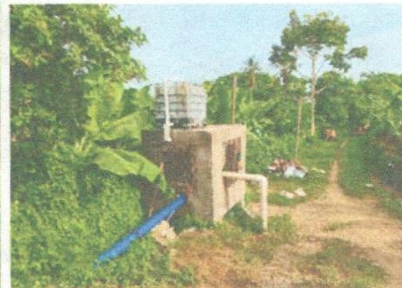
Captación Sector El Mamón