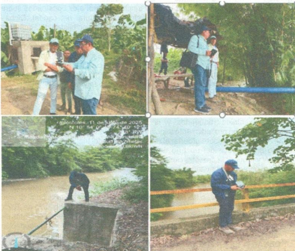
Registro Fotografico tomado en campo

Infracción ambiental identificada: ocupación de cauce a través de trinchos.”