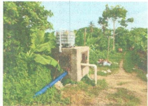
Captación Sector El Mamón