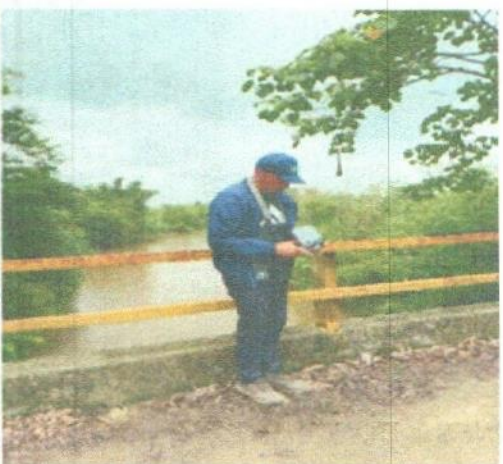
Registro Fotográfico tomado en campo

Luego de constatar los hechos denunciados ante esta Corporación Autónoma Regional, se puede observar que como resultado de la visita inspección ocular efectuada el 11 de junio de 2025 en el sector del río Frío, municipio de Zona Bananera (Magdalena), en cumplimiento del Auto No. 668 del 15 de mayo de 2025, se recopilieron evidencias fotográficas, observaciones en campo, registros georeferenciados y revisión cartográfica que permitieron establecer una serie de hallazgos relevantes en materia sancionatoria ambiental. A continuación, se presentan las conclusiones derivadas de esta diligencia técnica, las cuales resumen los impactos identificados, las presuntas infracciones normativas y las recomendaciones para el seguimiento y control por parte de esta Autoridad Ambiental.