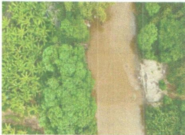
Trincho Predios MRS – Arenal