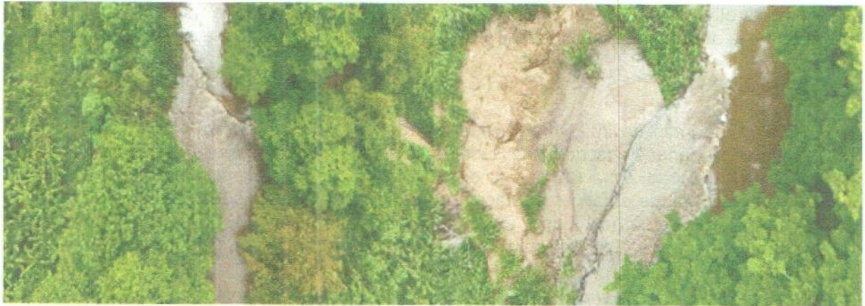
Trincho Predio Don Fuad 1

“POR MEDIO DE LA CUAL SE IMPONE A LAS EMPRESAS INVERSIONES M.R.S. S.A.S. Y AGRÍCOLA MARGARITA S.A.S., MEDIDA PREVENTIVA CONSISTENTE EN EL RETIRO INMEDIATO DEL TRINCHO O DIQUE ARTESANAL CONSTRUIDO EN EL CAUCE DEL RÍO FRÍO, MUNICIPIO DE ZONA BANANERA, DEPARTAMENTO DEL MAGDALENA, EN LAS COORDENADAS GEOGRAFICAS 10°52'03"N 74°12'17"W, Y SE TOMAN OTRAS DETERMINACIONES. EXP. SAN25- 6542”