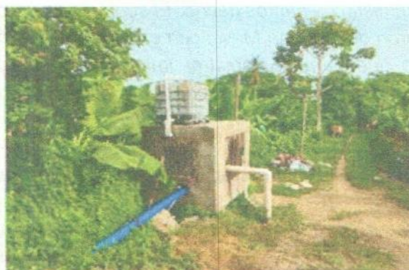
Captación Sector El Mamón