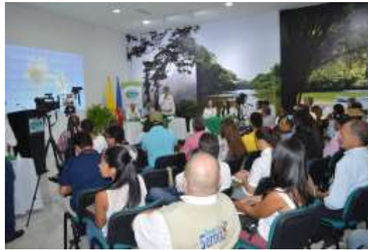
Audiencia Pública de Rendición de Cuentas

En la audiencia se presentó el informe de gestión de la vigencia 2018 y un video institucional. En la página web se encuentra publicado dicho informe: link http://www.corpamag.gov.co/archivos/planes/GP_20190307082856-1.pdf .