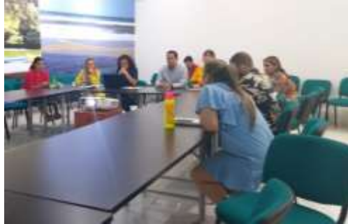
Conformación equipo de Rendición de Cuentas

Dirección con funciones de Control Interno. Se les hizo una presentación a los integrantes del grupo, sobre los componentes de la rendición de cuentas y su importancia.