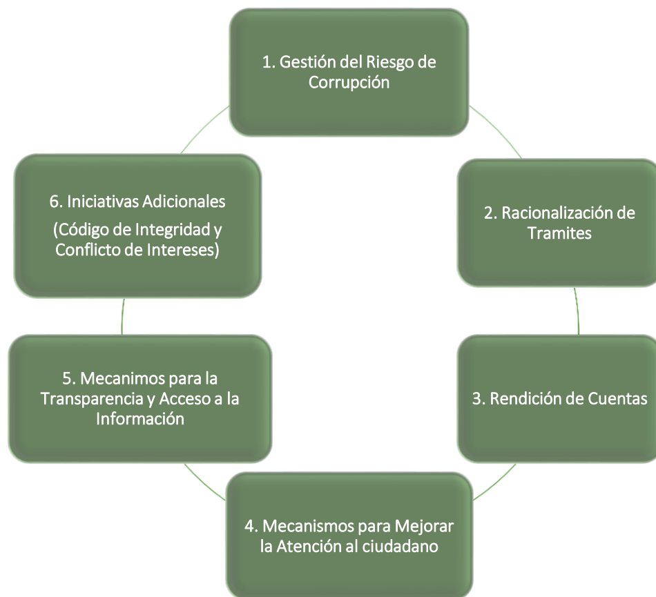
Gráfica 1 Componentes del PAAC 2023

Igualmente, el PAAC 2023 contempló la ejecución de 62 actividades y se encuentran distribuidas entre todos sus componentes y subcomponentes, como se relacionan a continuación: